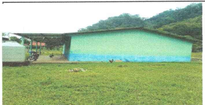
Foto 6: PINTURA DE LAS PAREDES DE LA ESCUELA EN MALAS CONDICIONES

Observación: Si es necesario se pueden agregar hojas adicionales y actualizar el número de hojas.